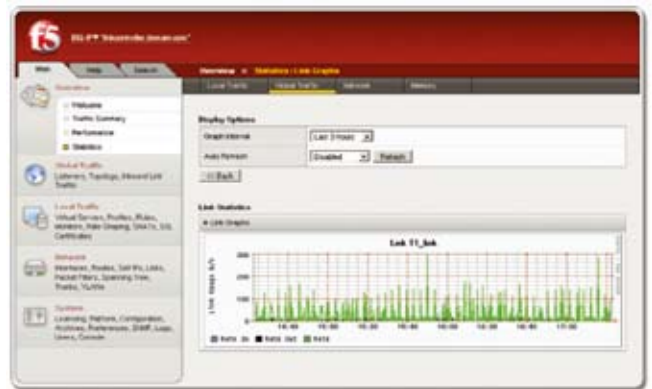
图形化的报表可以帮助您对带宽资源进行评估，从而及时做出有效的业务决策。

实时报告和历史记录报告可评估站点流量模式、相对ISP性能、以及预计和带宽计费周期，从而使您能够轻松监控带宽资源，作出明智的业务决策。